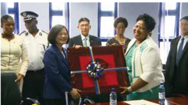
史國衛生部部长 S. E. Sibongile Ndlela-Simelane(右)致贈紀念品予蔡總統