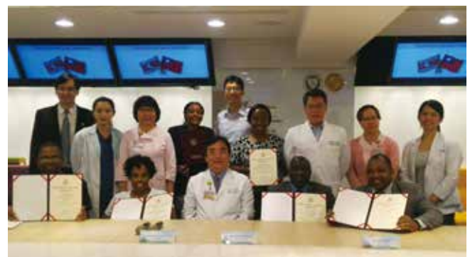
每年史瓦帝尼醫事人員來台至北醫附醫接受專業培訓