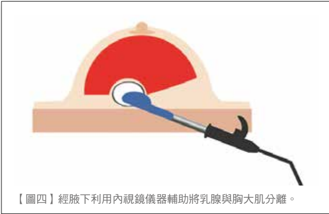
【圖四】經腋下利用內視鏡儀器輔助將乳腺與胸大肌分離。