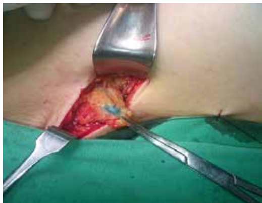
【圖二】腋下前哨淋巴腺切片

身體外形上或心理上都有極大衝擊影響。縱使在施行傳統「乳房保留手術」時也需於乳房皮膚劃一約 3 ~ 5 公分傷口，對腫瘤做局部廣範圍切除，同時在腋下另有一約 3 ~ 5 公分傷口，來進行前哨淋巴腺切片或腋下淋巴腺廓清術【圖二】。內視鏡乳癌微創手術祇於腋下劃一約 5 公分傷口，另外乳暈處則約有半個乳