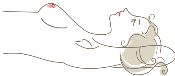
【圖三】內視鏡微創手術傷口位於腋下及乳暈

暈大小的傷口【圖三】，使手術傷口隱藏於較不明顯的位置，得以讓身體外觀改變的衝擊減至最低。