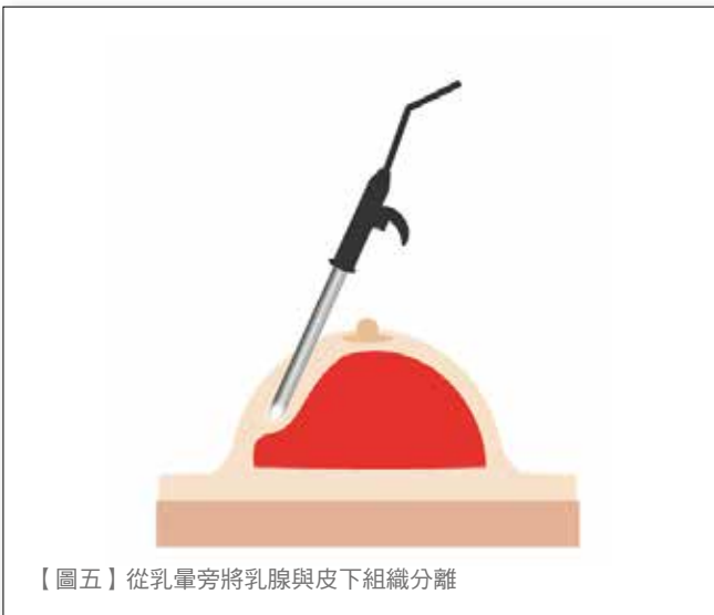
【圖五】從乳暈旁將乳腺與皮下組織分離

針對乳頭乳暈保留乳房全切除手術的患者，術中須採樣乳頭乳暈下的組織進行病理冷凍切片，以檢查乳頭是否有遭癌細胞侵犯。若冰凍化驗或術後病理報告顯示乳頭下組織有癌細胞侵犯，則須將乳頭乳暈進行切除。