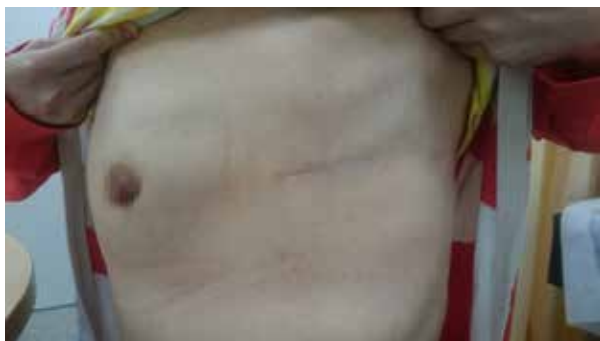
【圖一】傳統乳房切除傷口

傳統乳房切除手術範圍包括切除乳頭、全部乳腺、大部分胸前皮膚、併施行腋下淋巴腺切片或廓清術，會在胸前留下 15 ~ 20 公分長傷口【圖一】，不論對