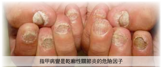
指甲病變是乾癬性關節炎的危險因子