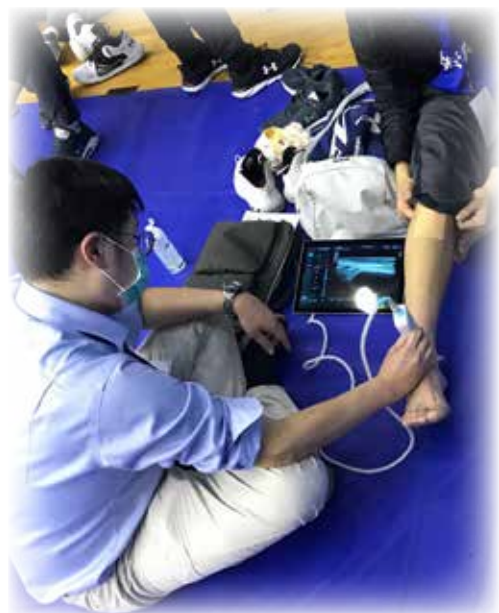
攜帶式超音波為受傷球員場邊即時檢查