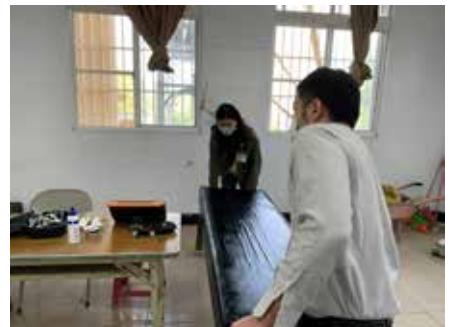
簡單粗陋的環境進行醫療服務