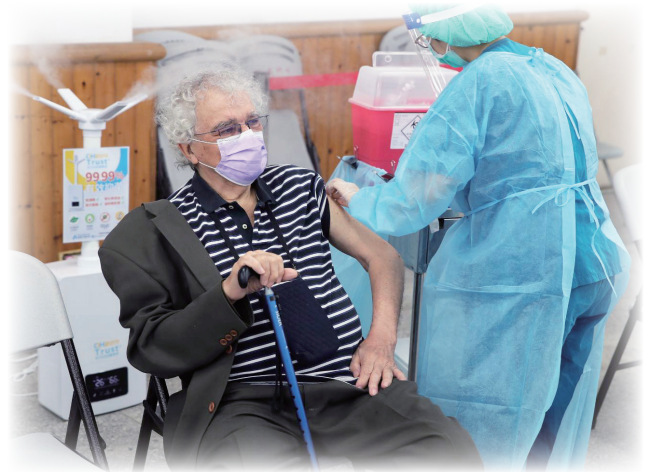
本院為全台首家提供75歲以上外籍長者接種COVID-19疫苗的醫院

由於本院設置「COVID-19 疫苗社區接種站」動線、服務流程良善，且本院承辦國際醫療服務經驗多次獲肯定，因此本站為臺北市政府公告唯一提供外國籍人士 COVID-19 疫苗接種站，於 110 年 6 月 24 日提供 75 歲以上外國籍長者施打疫苗服務；由國際醫療同仁於現場提供外語服務，本院疫苗接種資訊系統、掛號系統、現場標誌等以雙語呈現提供外籍人士友善環境；當日共服務了 21 位外國籍長者。