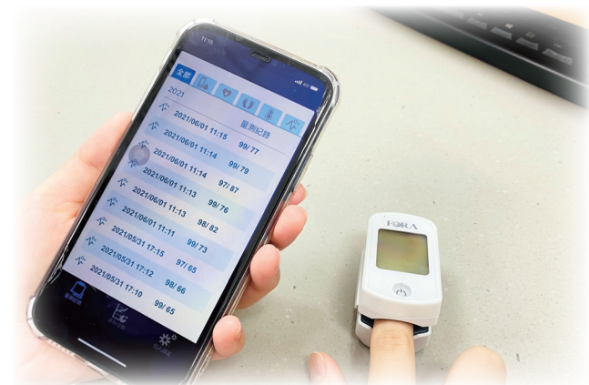
無症狀或輕症病患者，可考慮透過遠距照護，使用血氧飽和濃度偵測儀，藍芽傳輸數據至遠距照護系統，當心肺功能有明顯變化，遠端的照護團隊可及時介入