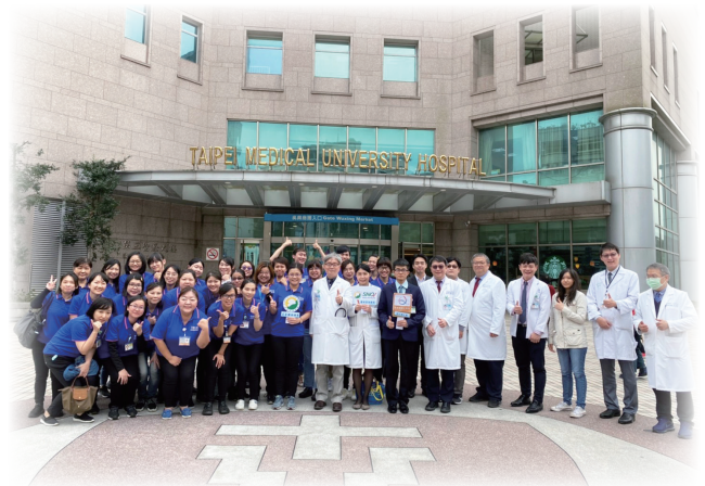
社區照護團隊合照