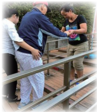
照護團隊協助社區長者進行復健

成立社區整合照顧中心，並承接台北市政府石頭湯服務，設置服務據點，以病家為中心、個管師為單一窗口，擬定客製化服務，結合居家醫療、居家服務、社區專業團隊、社福系統，提供全人、全家、全程服務，經由醫療與生活照顧、居家與社區復能、家屬支持性服務等，協助長者再站起來、並走出家門、步入社區，重新展現笑容、照顧者得以喘息並大幅降低照顧壓力，達到樂活社區之願景。