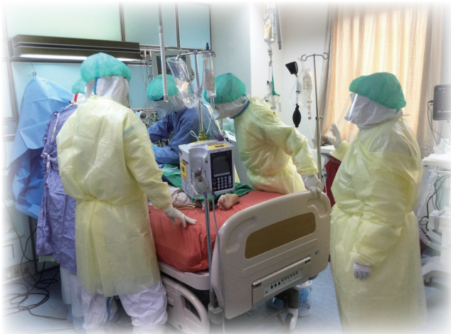
全副武裝穿戴防護裝備的醫護人員，正全力照顧病人

北醫附醫迅速擴建專責防疫病房，提升收治量能。今年5月10日至6月28日院內收治113名確診病人，其中已有79人康復出院。為持續提升照護品質並降低同仁染疫風險，本院於專責防疫病房啟用「全方位零接觸防疫照護系統」，提供遠距視訊醫療，大幅降低醫護人員非必要進出隔離區風險，成為前線醫護強而有力的後盾。