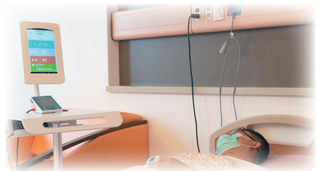
病人也可透過醫療車的螢幕看到自身體溫、血壓、血氧，掌握身體即時狀況，減緩內心不安