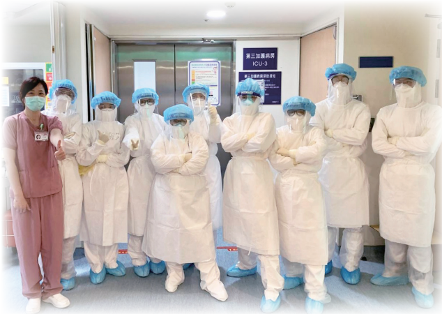
專責防疫病房團隊堅守醫療前線

新冠肺炎疫情嚴峻，隨著防疫升級第三級警戒，臺北醫學大學附設醫院除堅守醫療第一線，也強化多項防疫措施，包含每日召開防疫會議、實施醫療降載、設置戶外採檢站擴大篩檢、分艙分流、防護設備升級、運用防疫科技輔助、加強門禁管制及環境清消、同仁安心篩檢等規範，藉以確保醫院與同仁安全，持續守護民眾健康。