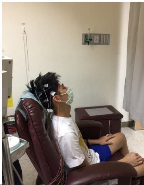
圖三 導線沾取傳導膠固定於頭皮