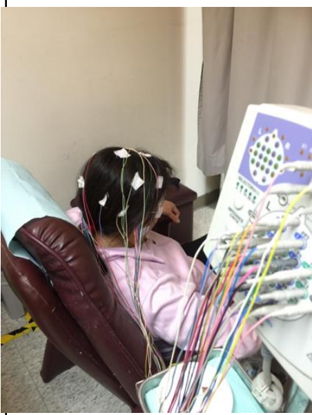
圖一 長髮者將頭髮綁馬尾以利導線固定