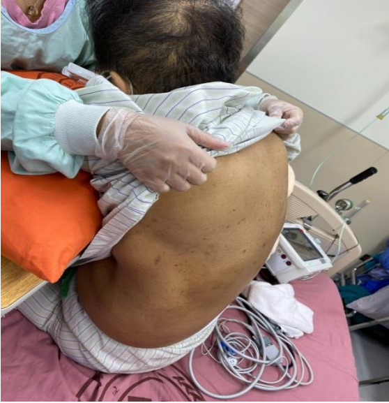
圖一 採坐姿，鬆開衣物露出背部，手和頭以輕鬆的方式趴在檢查桌上。