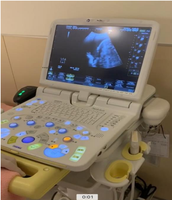
圖三 利用音波對胸部組織密度的不同，而將反射音波的深淺轉換成組織的影像，去分辨胸部有無異樣