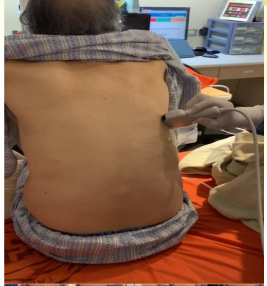
圖二 醫師塗抹潤滑傳導膠(會有冰涼感覺)，進行超音波掃描