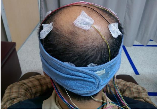
圖三 導線沾取傳導膠固定於頭皮，使用頭圍固定導線。