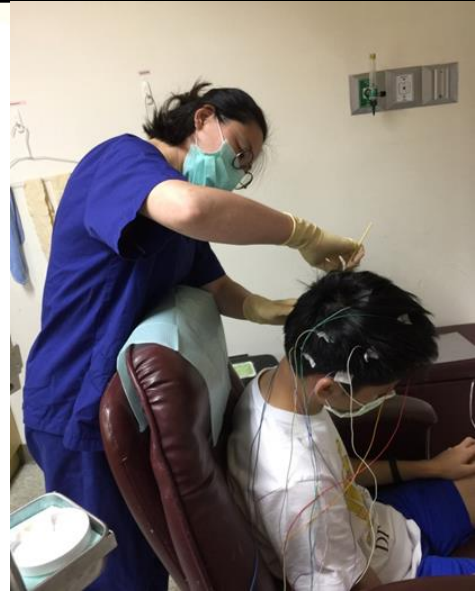
圖二 使用酒精或磨砂膏清潔頭皮