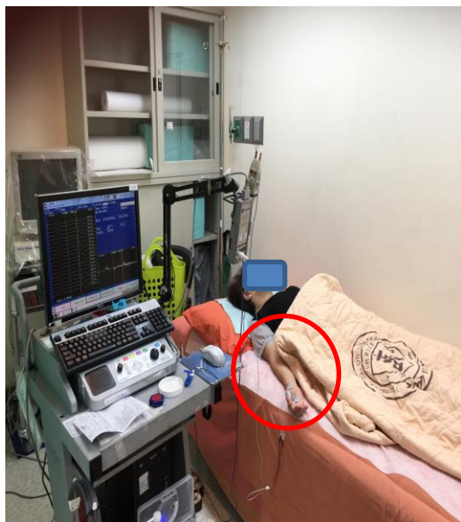
圖一 請受檢者平躺於床上，露出受檢部位，並告知有電刺激(直流電，電量小於100MA)，麻刺感或疼痛感，似觸電感覺。