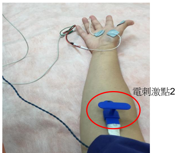
圖四 電刺激近身體端手肘周圍(紅圈處)