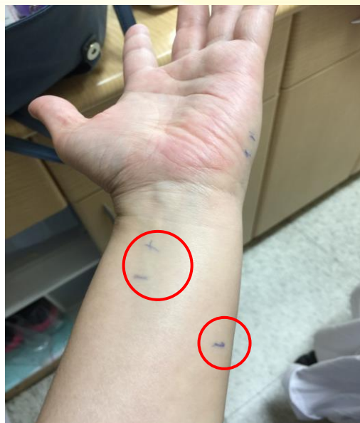
圖二 原子筆標示電刺激部位(紅圈處)